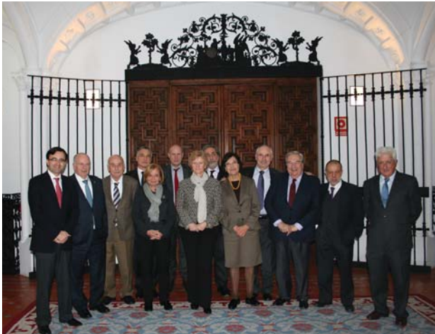
Reunión con los defensores autonómicos | Defensor del Pueblo