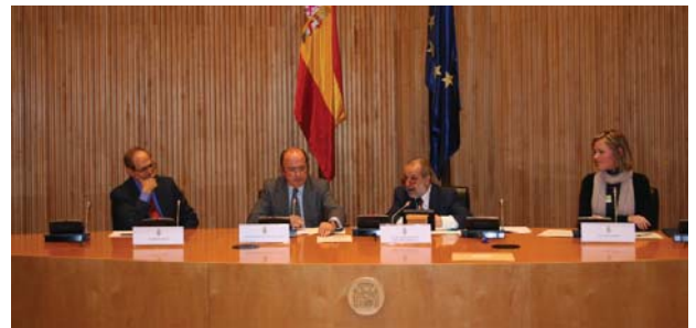
La entrega estuvo presidida por el Adjunto Primero | Defensor del Pueblo

que “un día, alguno llegará aquí, no de visita, sino a ser partícipe activo de la vida pública española”. En este sentido, les pidió que tengan siempre presente la importancia de tener “equilibrio entre poder y responsabilidad”.