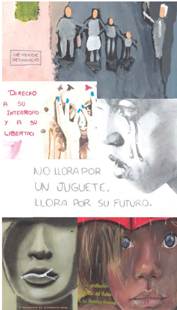
Los dibujos ganadores de Secundaria | Defensor del Pueblo