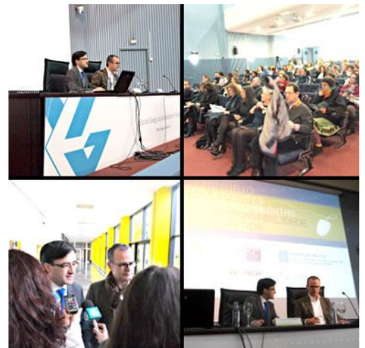
Varios momentos del Seminario organizado por el Valedor

Los datos recogidos permitieron estimar entonces en alrededor de un 15% los adolescentes que podrían estar haciendo un uso poco recomendable de Internet, a lo que habría que añadir un 5% que presentarían signos de uso patológico, lo que supondría que cerca de 4000 hogares gallegos tendrían un problema importante a este nivel. Estos datos advirtieron de la necesidad de poner en marcha planes de acción concretos de manera inmediata. El Seminario es buena prueba de ello.